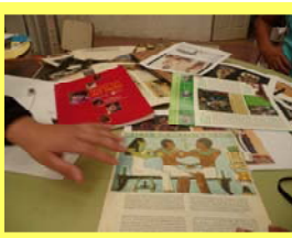
"los libros que usamos para copiar dibujos"