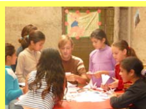
"el profe y las chicas haciendo origami"